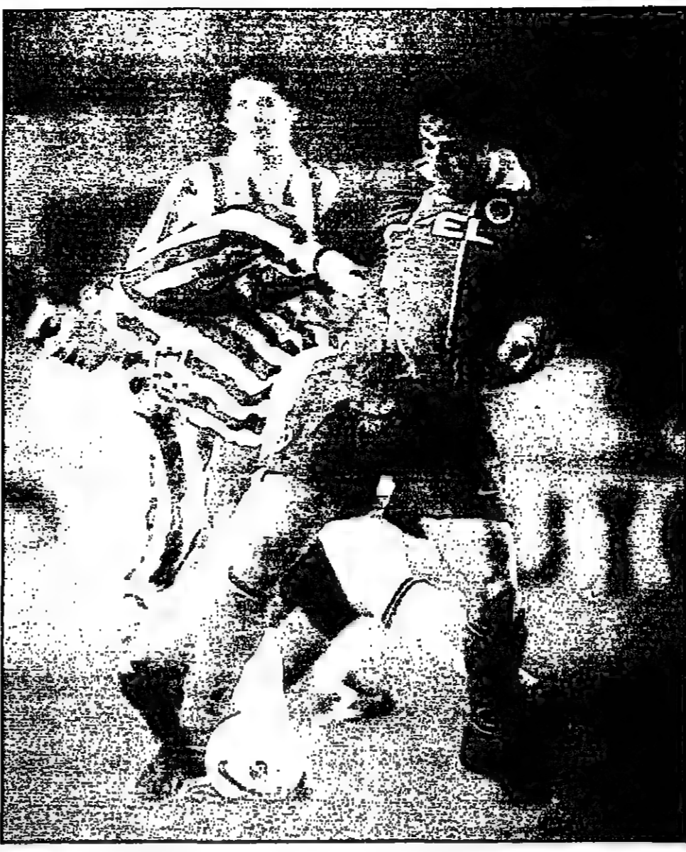
لقطة من المباراة

وفي استكتلندا ابل لاعبي وسط متشددين لتكثيرة لكرة القدم جون كاسوكين فريقه ويجوز من الضمارة امام مضيقه كيلمارنوك لفسول له هدف التعادل 1/1 في الدقيقة 78 من الدقيقة 48.